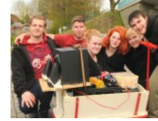
1. Mai Maiwanderer in Südwestfalen