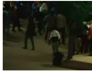
Flüchtlinge setzen Wohnheim auf Lampedusa in Brand