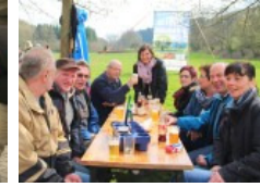
1. Mai Maiwanderer im Altkreis Brilon