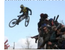
Sport, Show, Fun Dirt Masters Festival in Winterberg