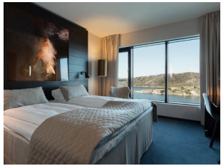
Mit Scandic Hotels durch den Sommer