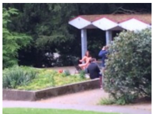
Verbotene öffentliche Sex-Show an Grillplatz im Grugapark | WAZ.de