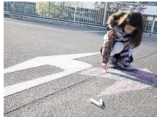
Mädchen malt mit Kreide auf die Straße – Bußgeldstrafe | WAZ.de