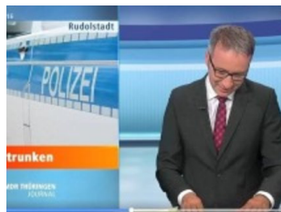
Betrunkenes Paar löst Lachanfall bei Nachrichtensprecher aus | WAZ.de