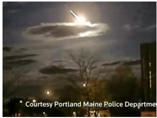
US-Polizei filmt Meteor an nächtlichem Himmel