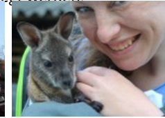
Känguru Fläschchen für Waisenkind