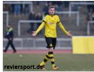
BVB II: Sechs Mann gehen